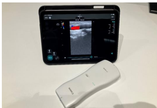
新製品のワイヤレス超音波診断装置をお見せいただきました。(Aplio air)

グローバル販売サービス体制に関しては、2022年～2023年にかけてインドとサウジアラビアに現地法人の立ち上げを行われました。これにより14の現地法人と、その他の代理店で合わせて世界190以上の国と地域をサポートしているそうです。2027年7月にはミナリスメディカルの株式を取得し、体外診断領域における事業の強化も図っていらっしゃいます。