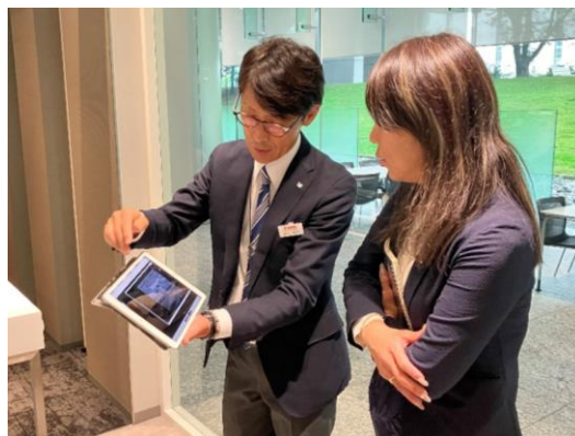
X線装置についても、臨床画像を見せていただきながらご説明いただきました。

将来のメディカルグループの目指す方向は、画像診断システム事業・ヘルスケア域事業・体外診断事業の3つの事業をさらに進化させることだそうです。長期的には再生医療やバイオ領域の間口を拡大することを目指していらっしゃいます。画像診断解析、体外診断、バイオ領域から医療情報をはじめ、さまざまな診断情報を融合させ、患者個人にとってより適切な治療をサポートするソリューションを提案し、プレジジョン・メディシンの発展に貢献することで事業領域の拡大につなげていくとご説明いただきました。