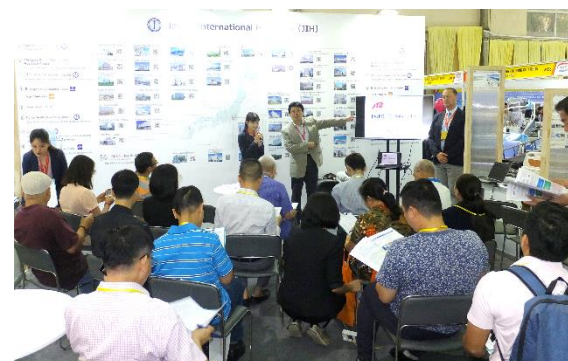
出展団体 ブース内セミナー