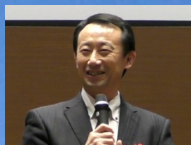
経済産業省 政策統括調整官 江崎 禎英様