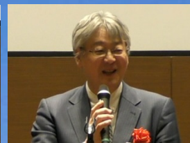
厚生労働省 審議官 椎葉 茂樹様